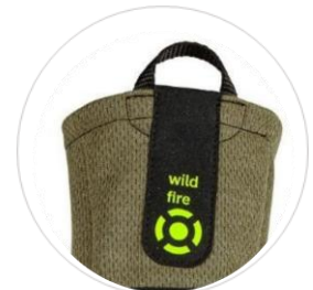
Long- Manschette und flammhemmendes Zugband