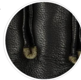
Der Bereich zwischen den Fingern ist speziell konstruiert